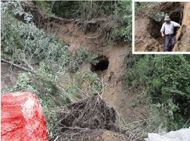
写真 1 水圧で巨大な岩塊が横に吹き飛ばされた事例 \Delta h \approx 130\text{m} とすると \alpha \approx 0.4 , 2003 年九州豪雨災害時

巨大な岩盤が横に吹き飛ばされているような現象（たとえば写真 1）は、斜面の途中であまり水圧消散口がない斜面で起きたものと推定される。